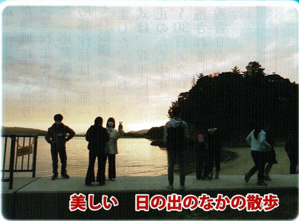
美しい 日の出のなかの散歩