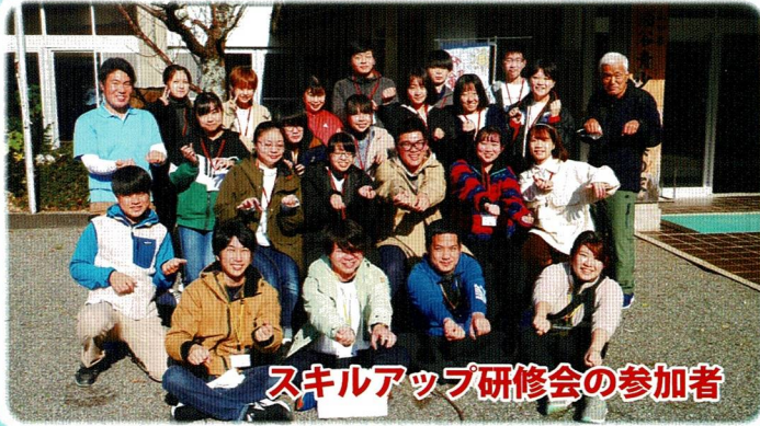
スキルアップ研修会の参加者

発行 (公社)福岡県青少年育成県民会議 〒812-0046 福岡市博多区吉塚本町13番50号 吉塚合同庁舎6F TEL(092)643-6001 FAX(092)643-6003 E-mail : net.y.d@isis.ocn.ne.jp ホームページ : https://fayd.jp/